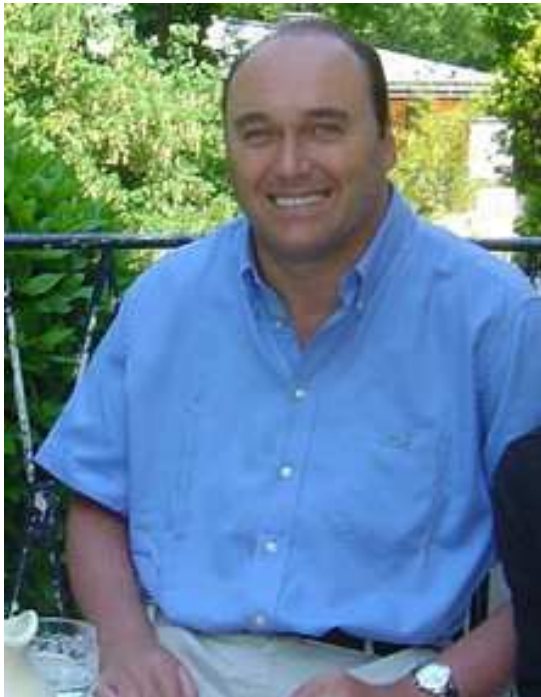
Philippe Streiff parrain de Figures de France

« Faire vivre nos passions en toutes circonstances ».