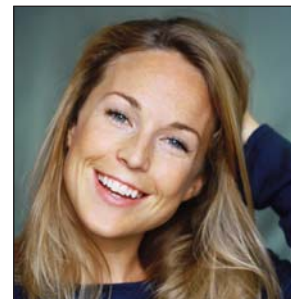
Aurélie Vaneck Actrice et ambassadrice Figures de France